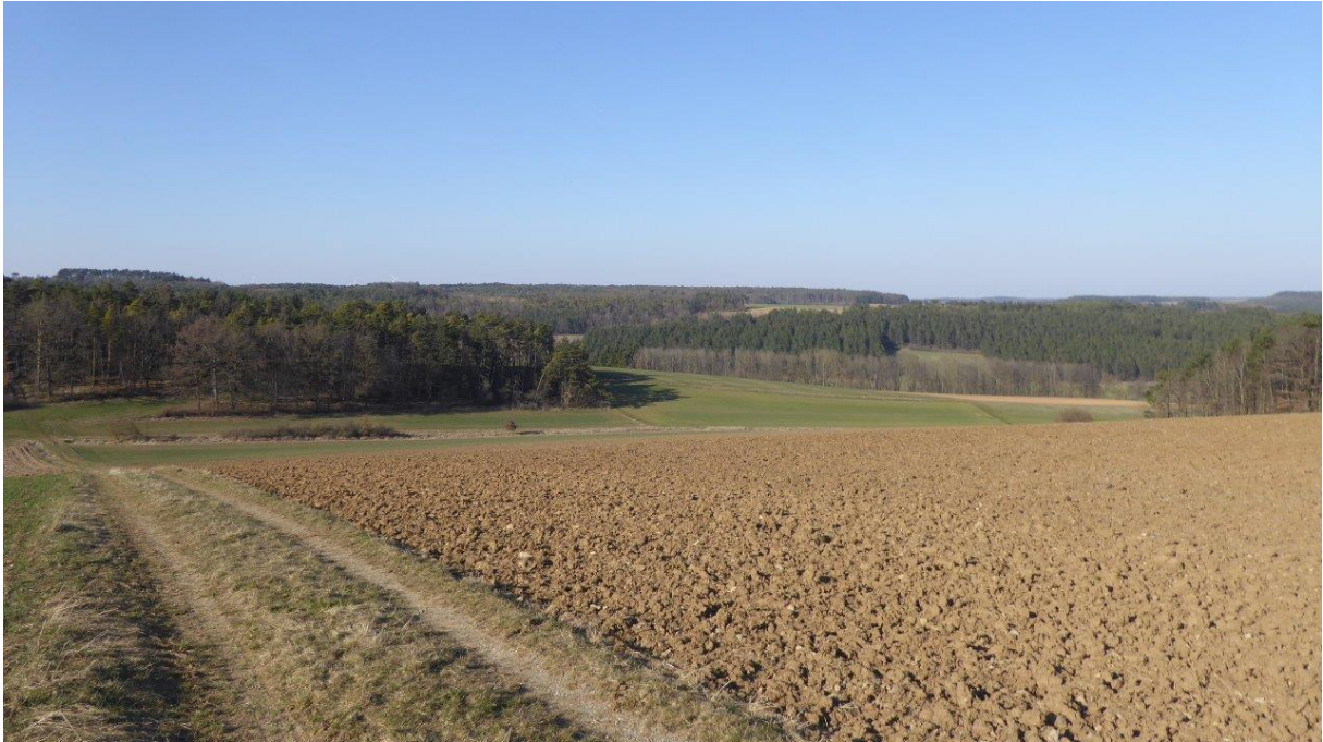
Abb.4: Blick von Süden nach Nordosten