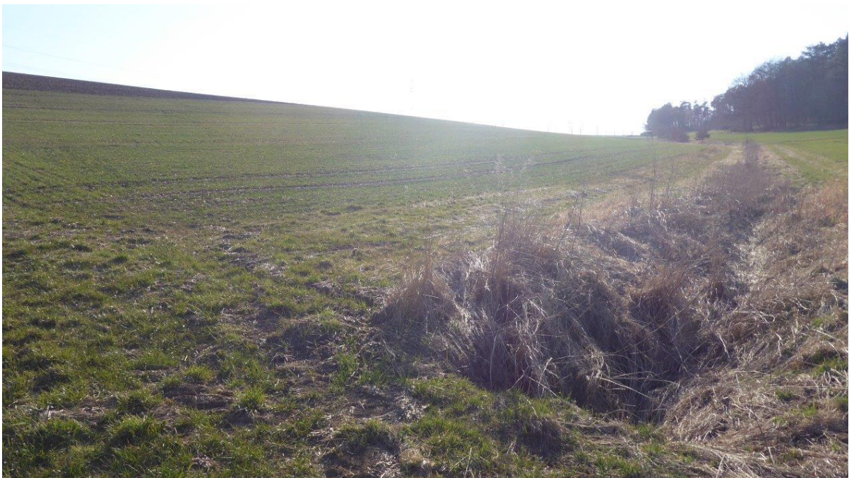
Abb.5: Östlicher Beginn des offenen Grabens